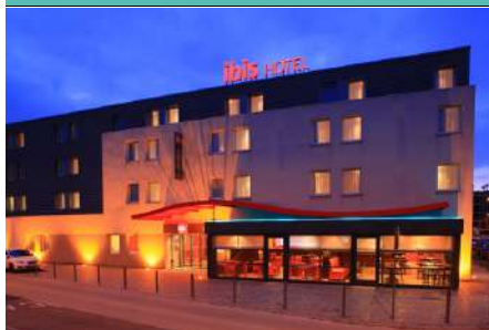
©Ibis Troyes Centre

5 minutes à pied suffisent pour rallier le centre-ville de Troyes depuis l'Ibis Troyes Centre.