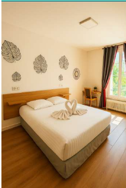
Hôtel du Cirque

L'Hôtel du Cirque est situé à 5 mn à pied du cœur historique de Troyes. L'établissement, entièrement rénové, vous permet de bénéficier de tous les avantages d'un hôtel de centre-ville.